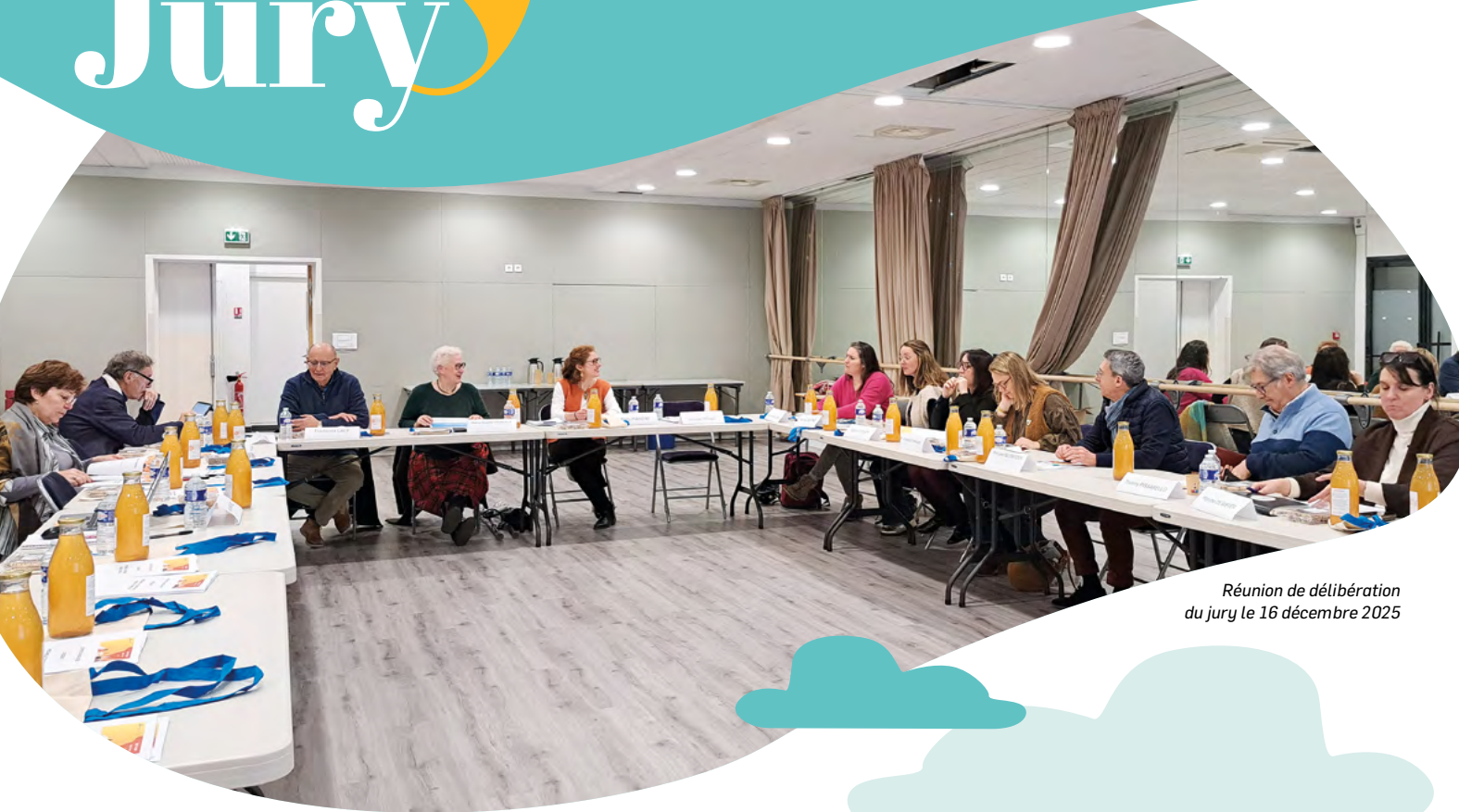
Réunion de délibération du jury le 16 décembre 2025